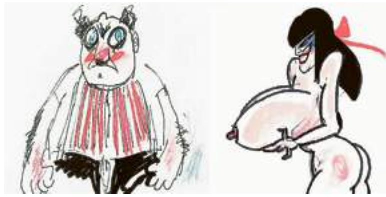
Due bozzetti di Federico Fellini per "Amarcord" e per "La città delle donne"

L'universo onirico di Federico Fellini, già raccontato nel "Libro dei sogni" (Rizzoli 2007), un diario tren-